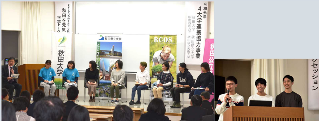
[令和元年度のトークセッションの様子]