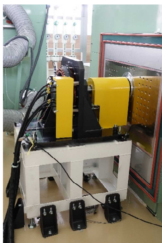
※ハルバツハモーター（横から見た写真。カバー有）

ハルバツハモーターとは、永久磁石をハルバツハ配列に基づき配置することで磁石の利用効率を最大化し、 大出力(高効率)化、小型化、軽量化 が期待できるモーターのことです。