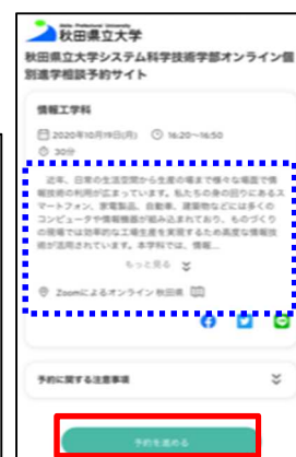
【スマートフォン版】