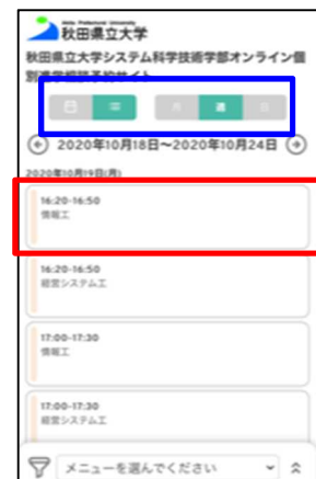
【スマートフォン版】