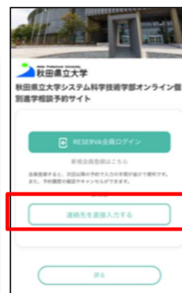
【スマートフォン版】