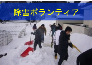
除雪ボランティア