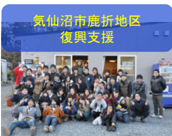
気仙沼市鹿折地区復興支援