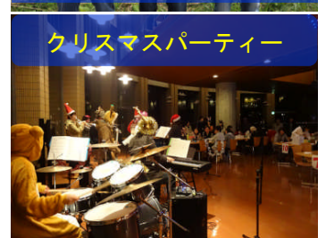
クリスマスパーティー