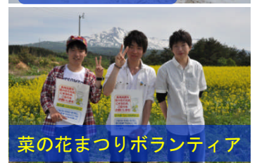
菜の花まつりボランティア