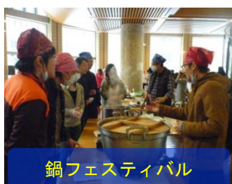
鍋フェスティバル