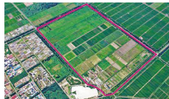
東京ドームなら40個分、サッカー場なら266面分のサイズ

総面積190ha(うち圃場面積164ha)は、大学附属農場の中で全国一の規模を誇ります。