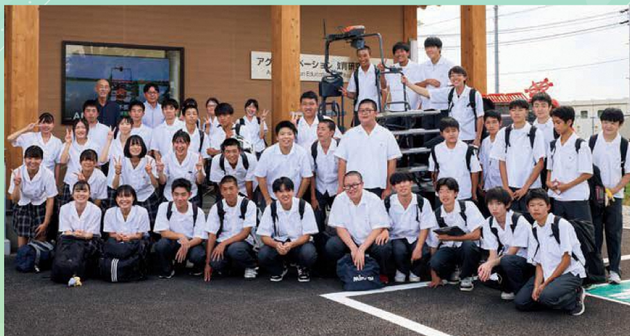
大曲農業高校3年生の希望者と1年生の皆さん

スマート農業普及の取り組みとして令和5年9月、大曲農業高校の生徒が参加して体験学習を実施。スマート農業に関する講義や、「未来農業を創る」をテーマにグループディスカッションを行いました。