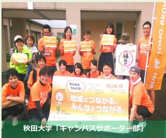
秋田大学「キャンパスサポーター部」

秋田を元気にする様々な活動を行っている県内国公立4大学の学生によるトークセッションを開催しました。自分たちが目指していること、秋田への想い、地域貢献とは？学生達が本音で熱く語り合いました！！