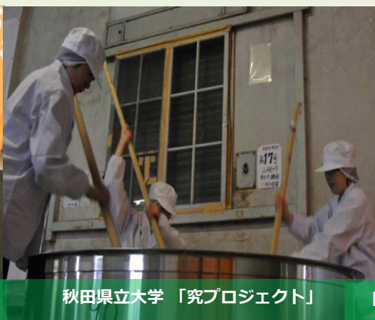
秋田県立大学「究プロジェクト」