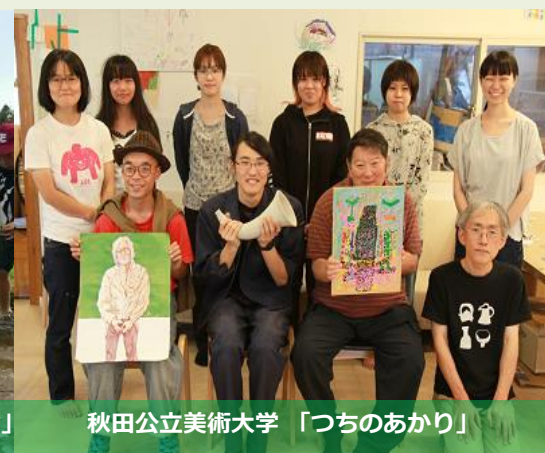
秋田公立美術大学「つちのあかり」