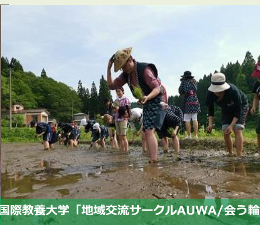
国際教養大学「地域交流サークルAUWA/会う輪」