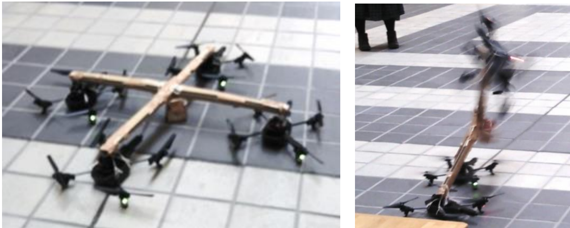
図3 4機のAR.Droneを制御した様子（左：4機のAR.Droneと固定器具，右：墜落した瞬間の様子）