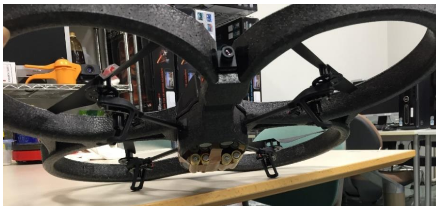
図 1 1 機の AR.Drone での実験

しかし、左右移動が操作不可能になった。原因は、乾電池を乱雑に貼り付けたため、重心に偏りが生じたからと考えられる。