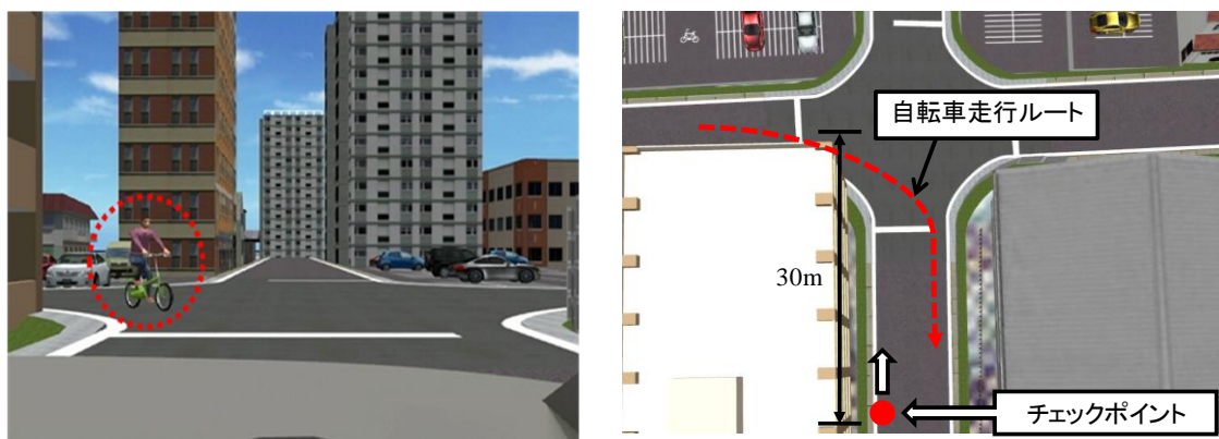
図3 イベントの定義