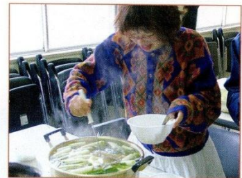
はじめての「しよつる鍋」づくり。

その他にも、「ハタハタ寿司の製造」や「アイスキャンドル」づくりなどを体験しました。