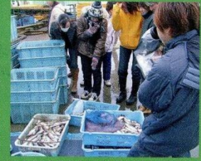
取れたての新鮮なハタハタと初対面!

自然や農業・農村との交流を基本とする遊びの場を通して、人間力を培う新しい取り組みが始まります。