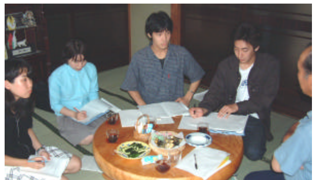
地域住民からのヒアリング調査