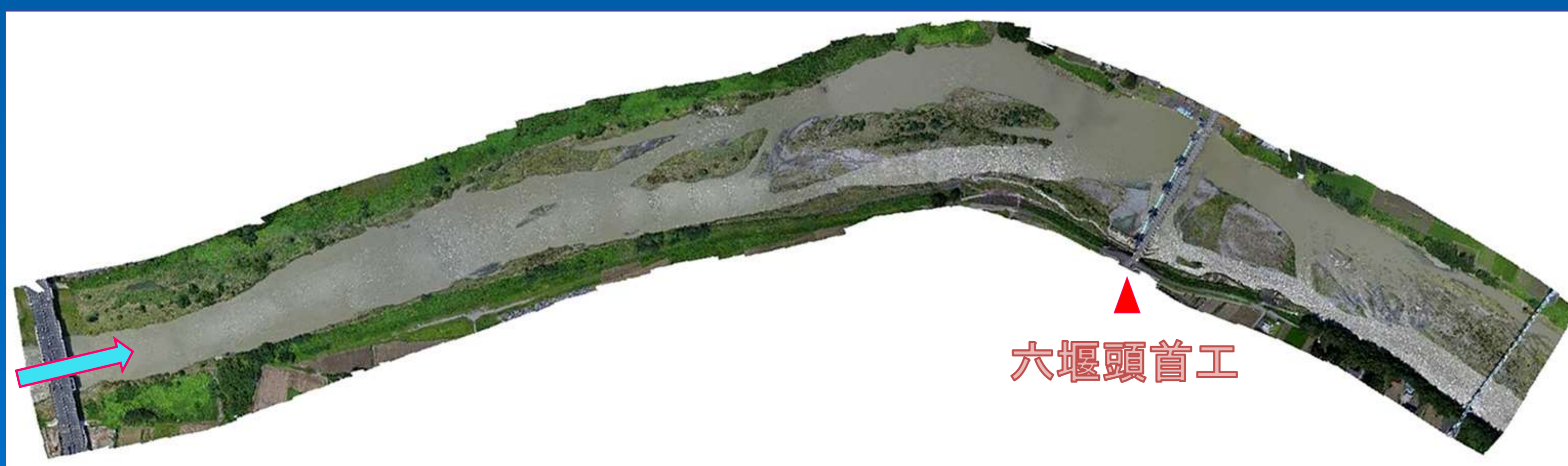
図-1 六堰頭首工周辺の河床の状況(オルソモザイク画像)

図-1より、右岸側の河道湾曲部内岸付近では、頭首工の上下流に寄洲が形成されていることが確認できる。本頭首工は土砂吐ゲート1門、洪水吐ゲート4門からなる全面可動堰であるが、右岸側から計3門のゲート敷上に堆砂が見られることから、洪水吐ゲートの開閉作業に何らかの支障をきたしていることが推察される。また、頭首工の下流側には広い範囲で岩盤が露出しているのも確認できるが、これらは流下障害の要因となるため、本頭首工でのゲートフラッシュによる排砂は困難であると考えられる。